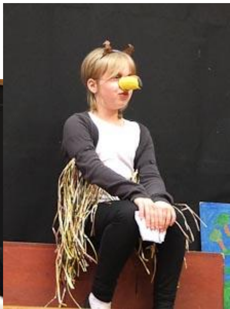
Die Mäuseprinzessin Liliweißwieschnee wurde von den Seeräuberkatzen gefangen genommen und musste zu deren Vergnügen tanzen (Lilis Tanz).